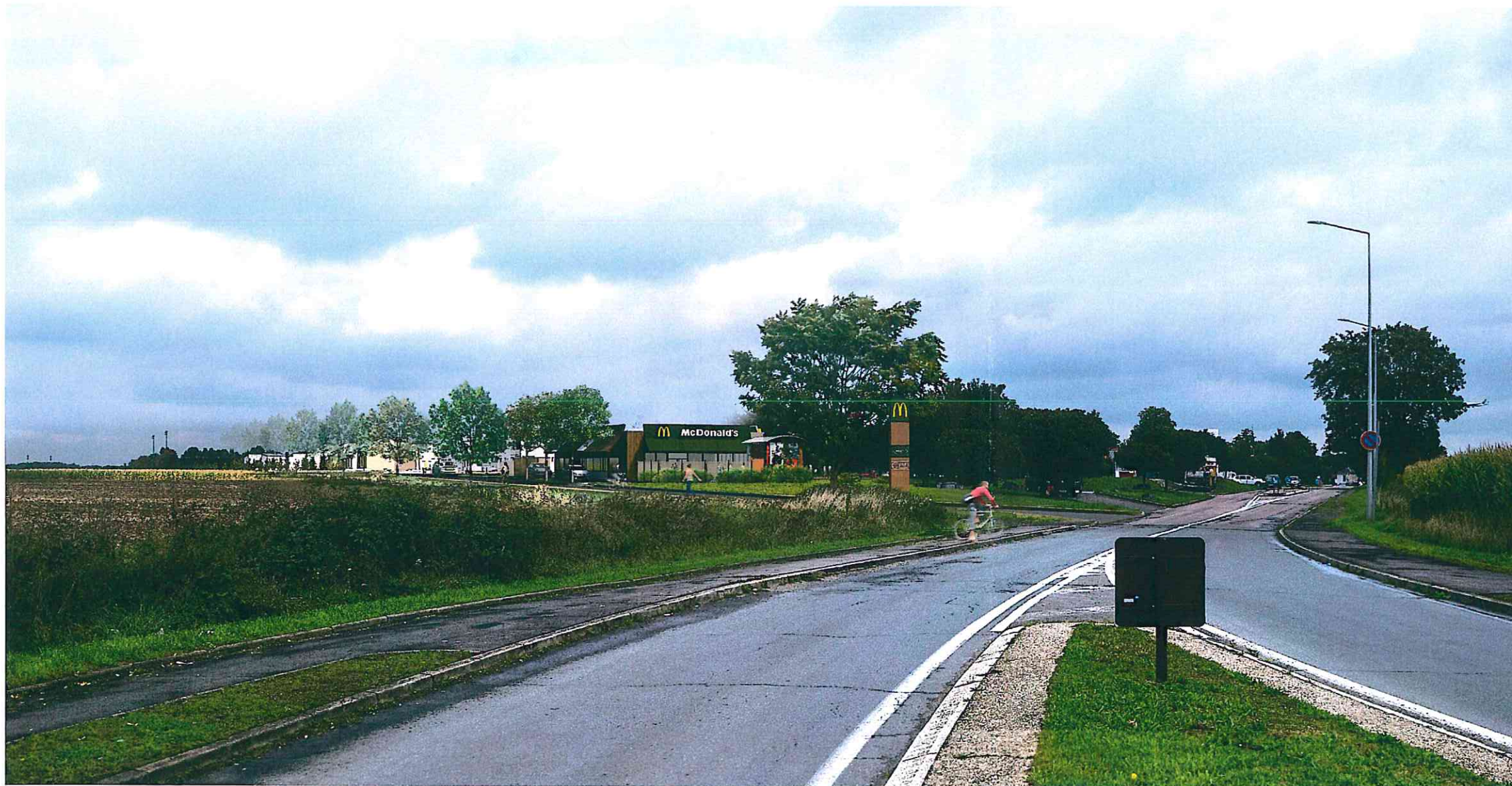
Vue d'insertion / État projeté

McDonald's France S.A.S. au Capital de 57 459 000 Euros 1, rue de la République 78000 MONTAIGNEY-LEZ-BOIS 22 023 83 71 57 / 22 023 83 71 57 Tél. : 01 65 60 80 00 / Fax : 01 30 48 63 60 ATL AGENCE D'ARCHITECTURE T. LAZARD 47 rue de Valenciennes (75013) - PARIS 01 53 17 03 31 - www.atl-architectes.com