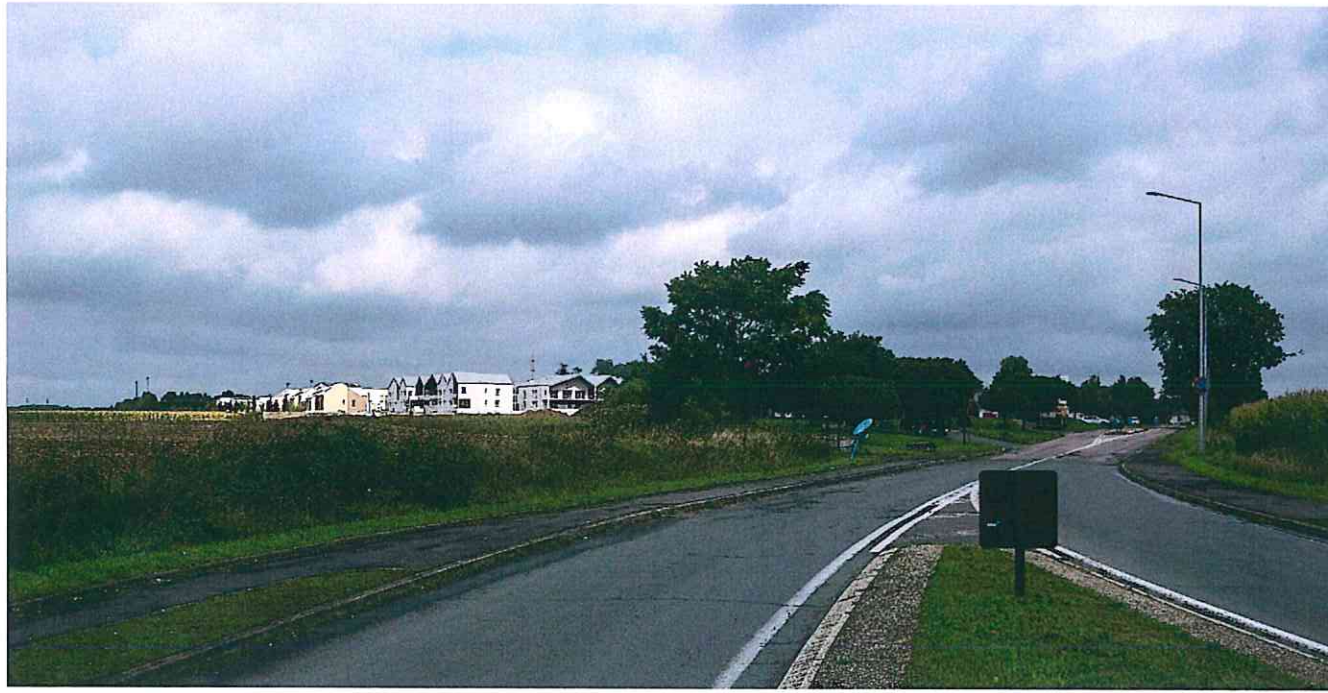
Vue état existant