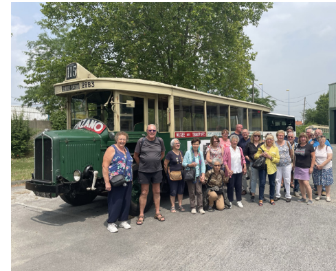
Balade à Chelles