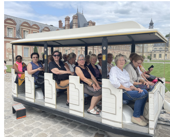
Promenade au château de Fontainebleau