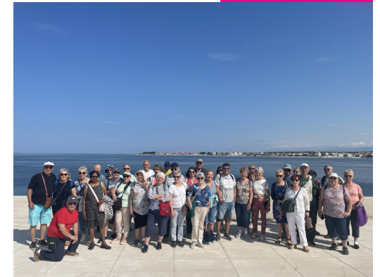
Voyage en Croatie