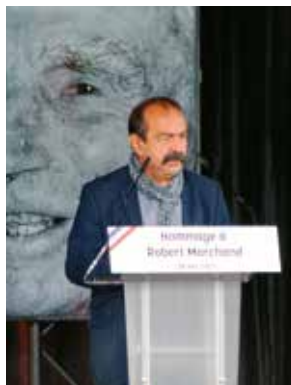
Philippe Martinez, secrétaire général de la CGT