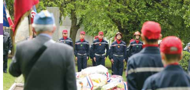
Cérémonie de commémoration du 8 mai 1945, mai 2014