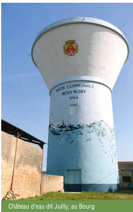
Château d'eau dit Juilly, au Bourg

En 1970, naissait la Régie communale d'eau et d'électricité de Mitry-Mory. 45 ans plus tard, la RCEEM est toujours guidée par l'intérêt général.