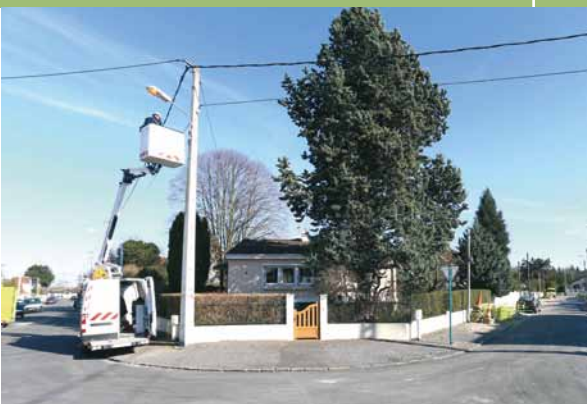
Dépannage d'un point lumineux, mars 2015