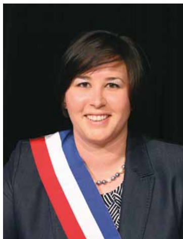
Charlotte Blandiot-Faride, maire de Mitry-Mory