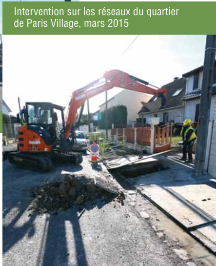
Intervention sur les réseaux du quartier de Paris Village, mars 2015