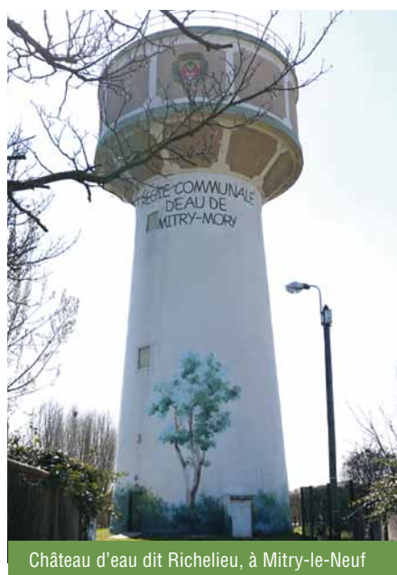
Château d'eau dit Richelieu, à Mitry-le-Neuf