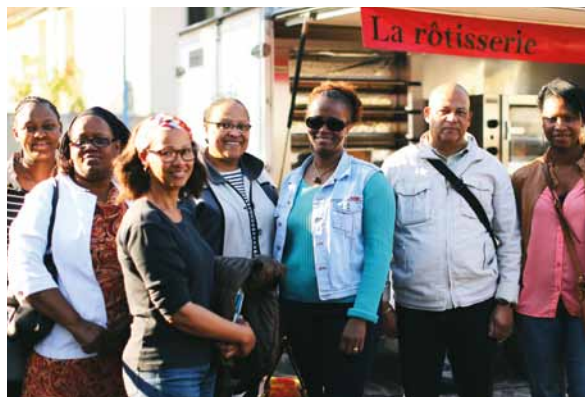
Le Bourg inaugure son marché du soir.