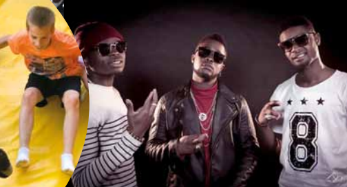
Diaspora full option 2.0