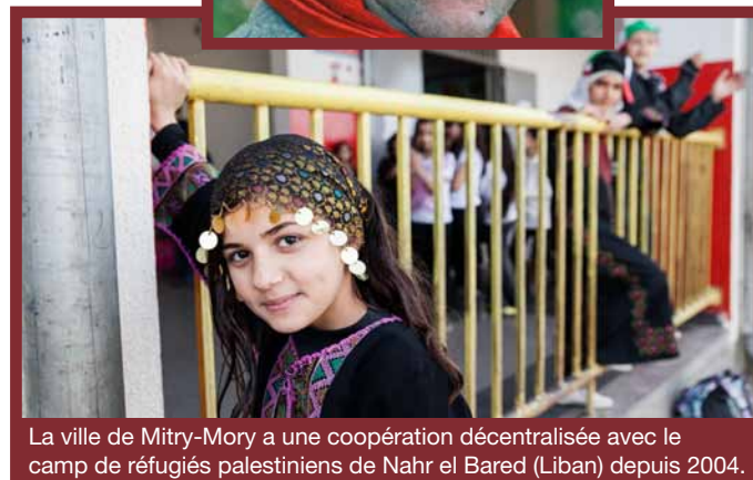
La ville de Mitry-Mory a une coopération décentralisée avec le camp de réfugiés palestiniens de Nahr el Bared (Liban) depuis 2004.