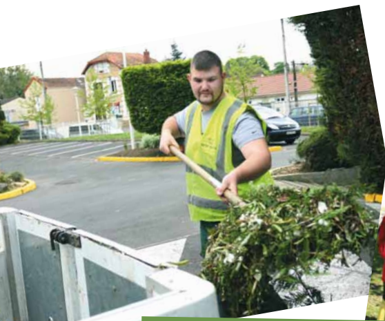
Les jeunes apprentis Mitryens travaillent consciencieusement aux côtés de leur tuteur.

« À son échelle, la ville développe des dispositifs d'insertion et de formation pour les jeunes. Chaque année nous accueillons des apprentis ainsi que des stagiaires, des saisonniers, etc. C'est donc naturellement que nous avons créé 7 contrats d'avenir. Nous espérons qu'à l'inverse des emplois jeunes, l'État réussira à pérenniser ces emplois. Notre ambition est qu'au-delà des contrats, ces jeunes puissent acquérir une vraie expérience et une réelle formation qui puissent être pour eux les bases de leur vie professionnelle. J'en profite pour remercier les agents communaux qui ont accepté d'être leurs tuteurs tout au long de leur formation ».