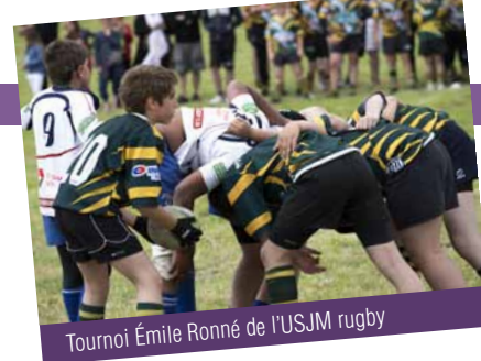
Tournoi Émile Ronné de l'USJM rugby

Kermesse de l'école Émile Zola de 9h à 12h