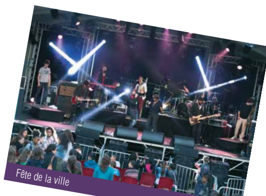
Fête de la ville

Gala annuel de l'USJM gymnastique de 19h30 à 23h gymnase Jean Guimier