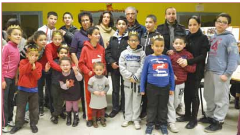
Vendredi 24 janvier à la maison de quartier de la Briqueterie.