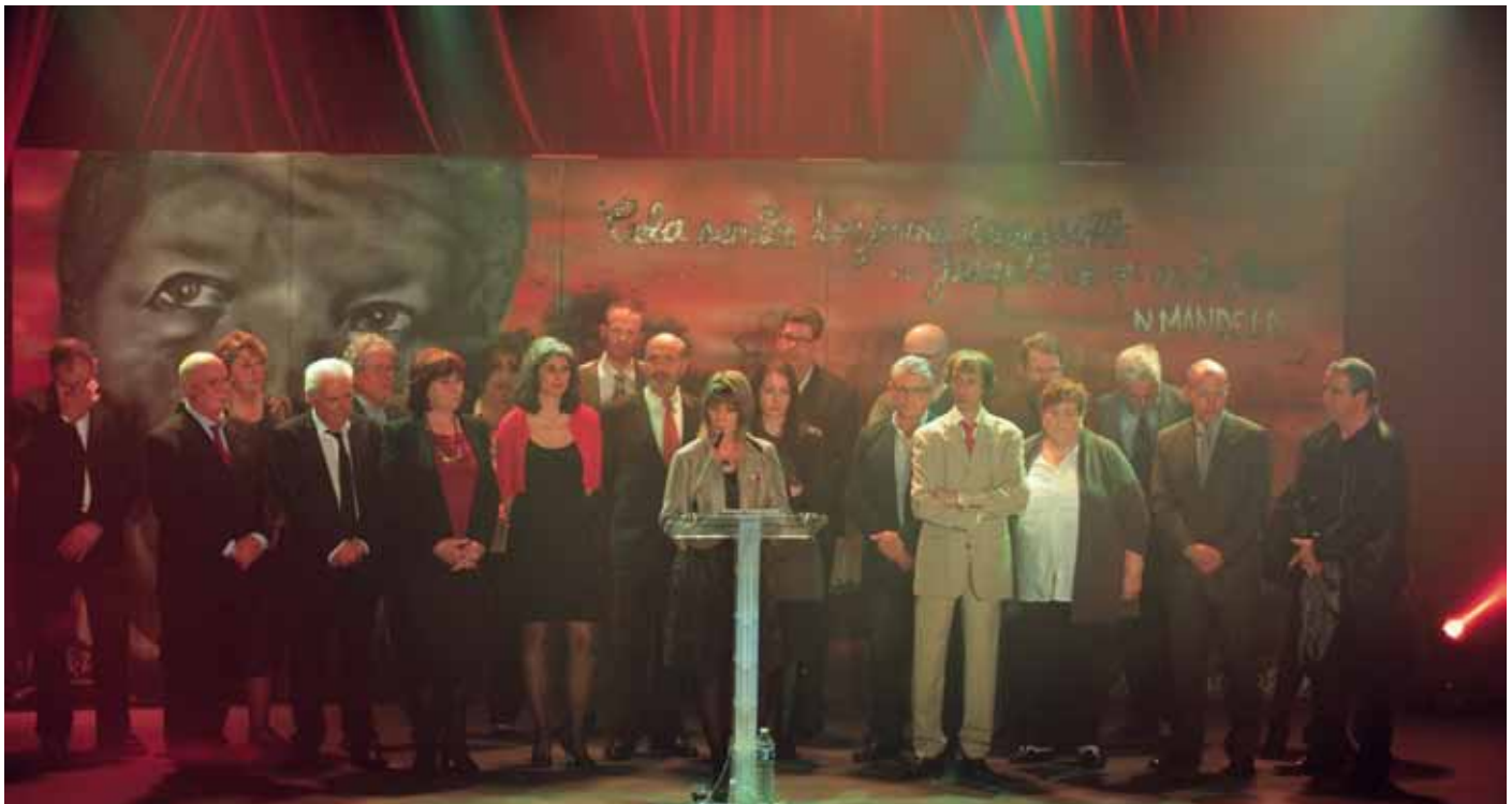
Les membres du Conseil municipal lors de la cérémonie des vœux.

600 personnes ont répondu présent à l'invitation du maire de Mitry-Mory, pour participer à la cérémonie des vœux. Parmi elles, des maires, des élus des communes voisines, des représentants du Conseil général et du Conseil régional, de l'État, des parlementaires, des représentants des corps constitués, des associations, des syndicats. Comme il est de coutume, l'accueil des invités s'est fait en musique. Pendant que Madame le maire saluait un à un les participants, le Big Band du conservatoire, dirigé par Sylvain Leclerc, jouait des mélodies bien connues de tous. Sous un halo de lumière blanche, chacun a pu admirer les photos des habitants de Mitry-Mory, prises au cours de l'année écoulée par les photographes du Bar Floréal, un collectif d'artistes en résidence pour 3 ans dans la ville.