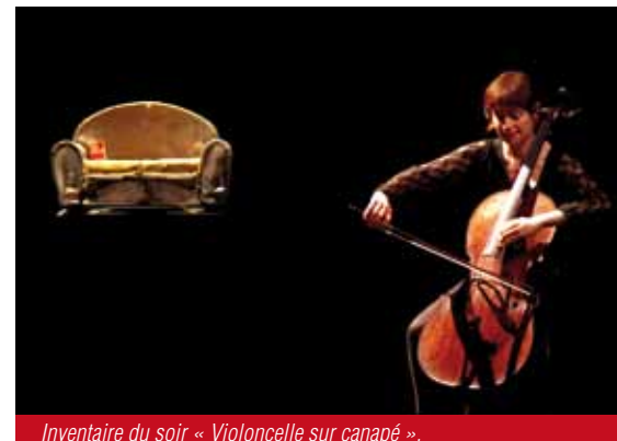
Inventaire du soir « Violoncelle sur canapé ».

Spectacle + buffet : 5,5 € / adultes et 3 € / enfant (gratuit moins de 3 ans)