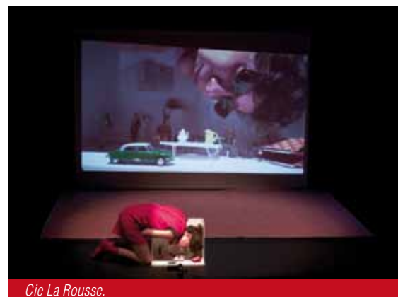
Cie La Rousse.

Réservation obligatoire, les billets sont à retirer au CMCL aux heures d'ouverture du secrétariat : lundi, mardi, mercredi 14h-19h, mercredi 9h-12h et 14h-19h, vendredi 14h-18, samedi 9h-12h