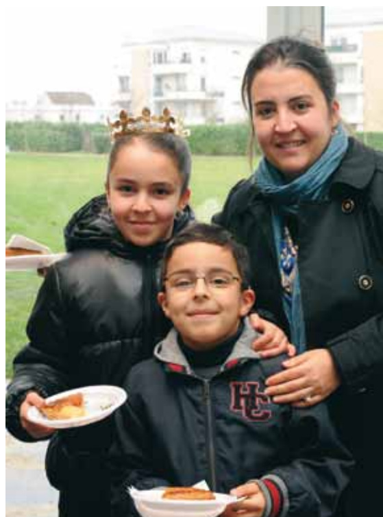
Samedi 11 janvier à la maison de quartier des Acacias.