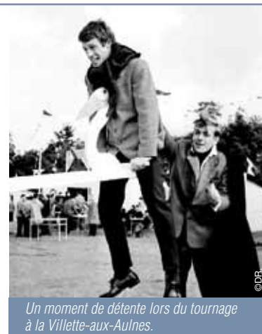
Un moment de détente lors du tournage à la Vilette-aux-Aulnes.