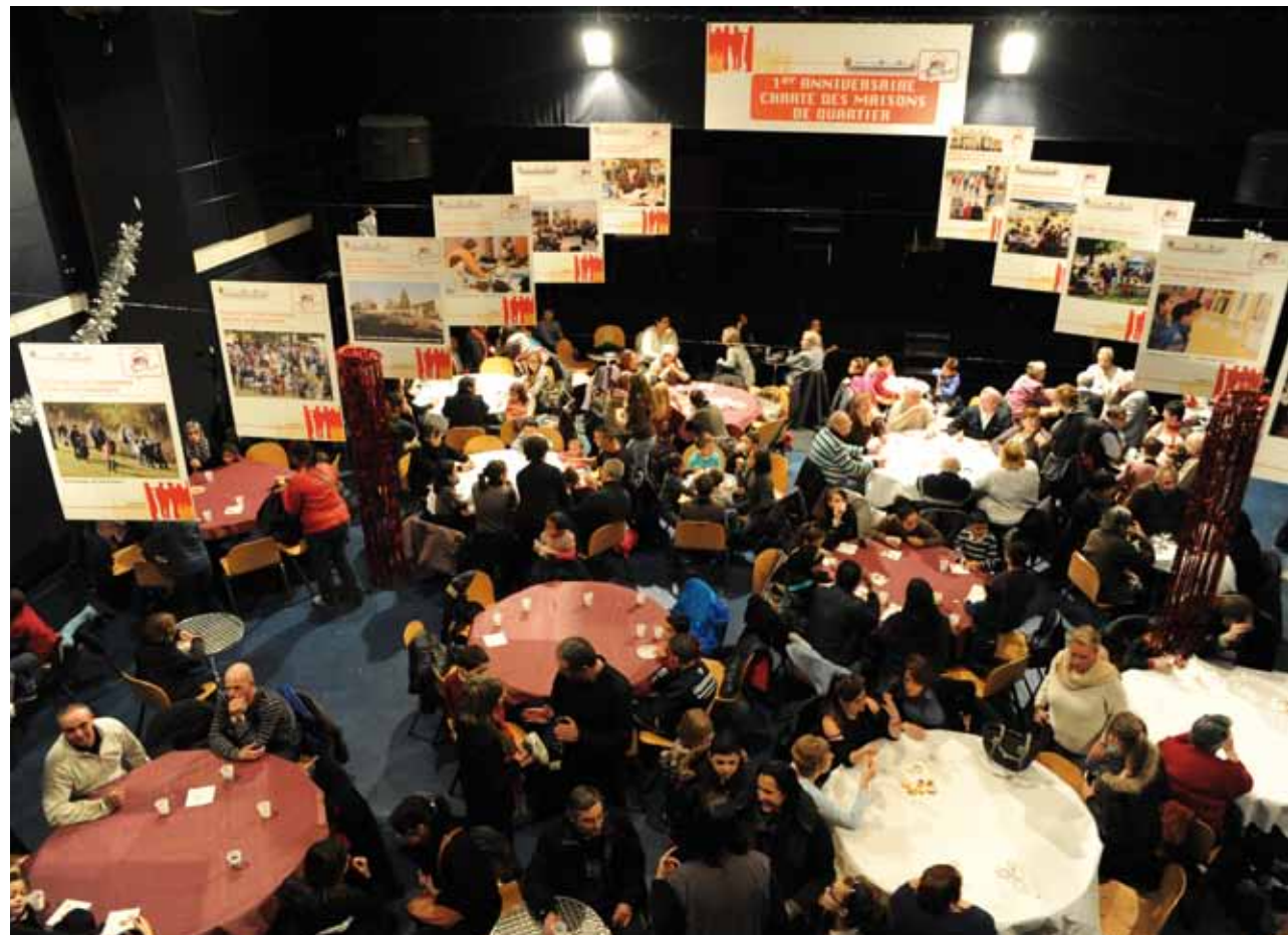
Célébration du premier anniversaire de la Charte des maisons de quartier.