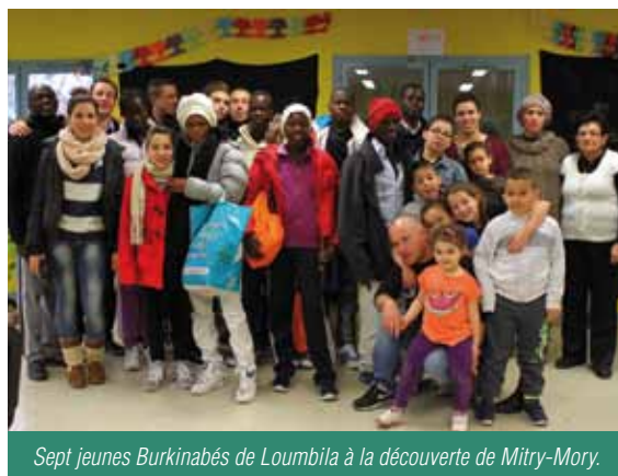
Sept jeunes Burkinabés de Loumbila à la découverte de Mitry-Mory.