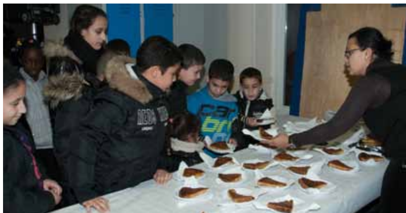
Vendredi 17 janvier à la maison de quartier du Bourg.