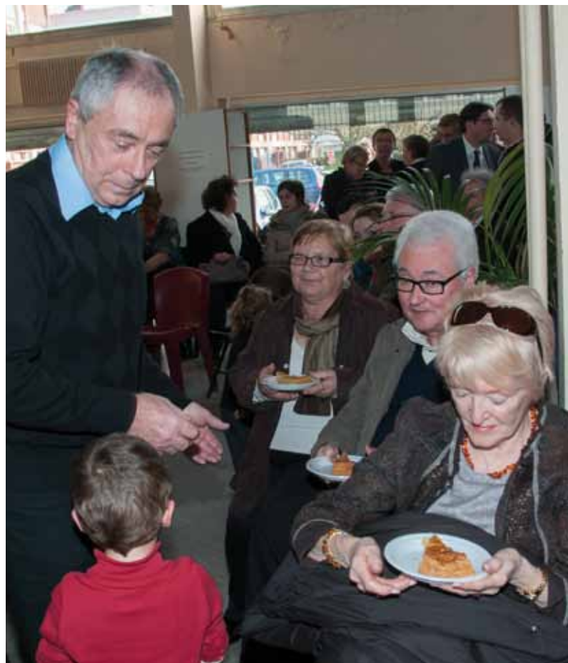
Samedi 18 janvier à la maison de quartier de Cusino.