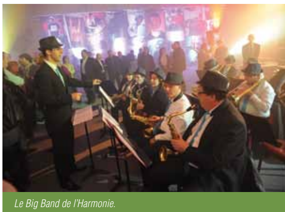
Le Big Band de l'Harmonie.