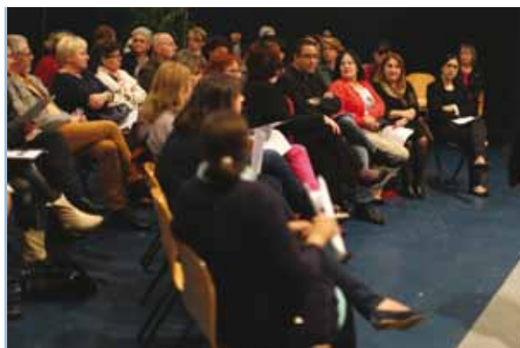
Journée internationale des droits des femmes.