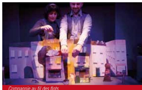
Compagnie au fil des flots

C'est l'histoire d'une transmission entre un grand-père et son petit-fils... Sachou découvre que son grand-père, Papic possède des trésors cachés dans sa barbe. Au fur et à mesure que l'enfant grandit, le grand-père dévoile l'histoire de ces trésors. Un hameçon, un clou et une rose sont à l'origine de moments importants dans la vie du grand-père. Avec le dernier trésor, Sachou prend sa place dans le prolongement d'une histoire qui traverse le temps... 5,50 €/ non adhérents et 4 €/ adhérents CMCL.