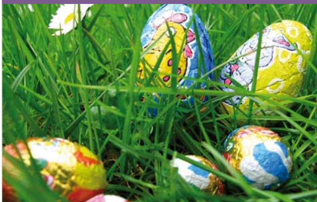
Chasse à l'œuf.